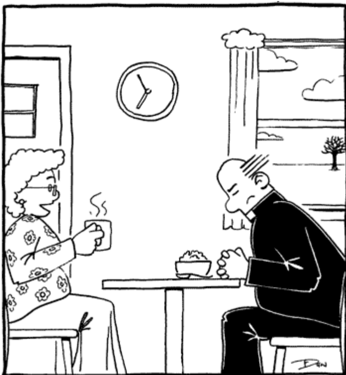
»Lahko moliš kakorkoli, ovsena kaša bo še vedno ovsena kaša.«