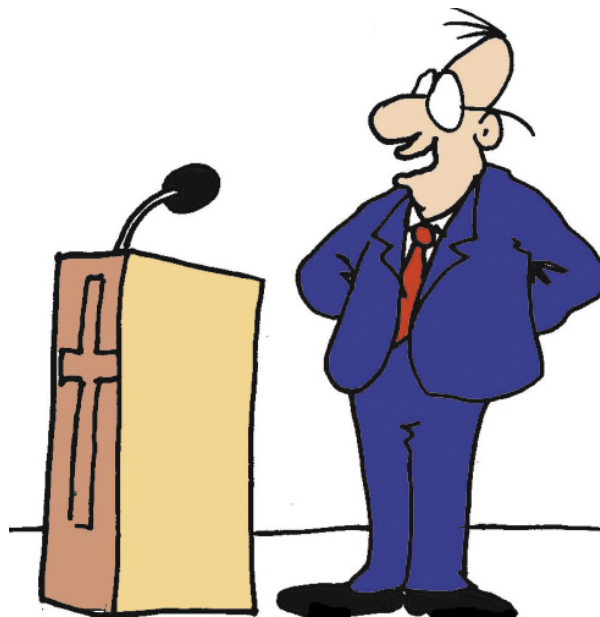
»S tem zaključujem današnjo pridigo. Drugačna stališča lahko najdete na e-strani www.kriva-vera.si .«