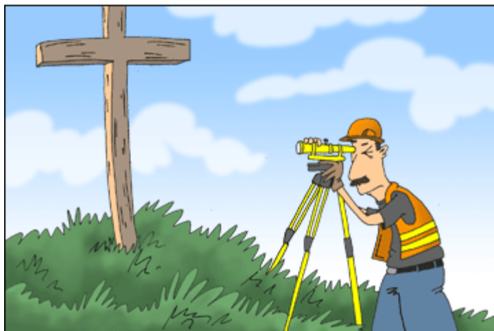
Vsi ostali samo govorijo o tem, da je treba gledati na križ, medtem ko on to v resnici počne!