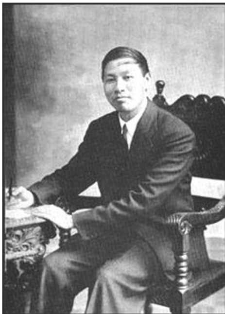
Watchman Nee ali Ni Tuoseng (1903 - 1972), krščanski voditelj na Kitajskem

Zakaj Bog zavrača starejšega in sprejema mlajšega? Tako kot pove tudi