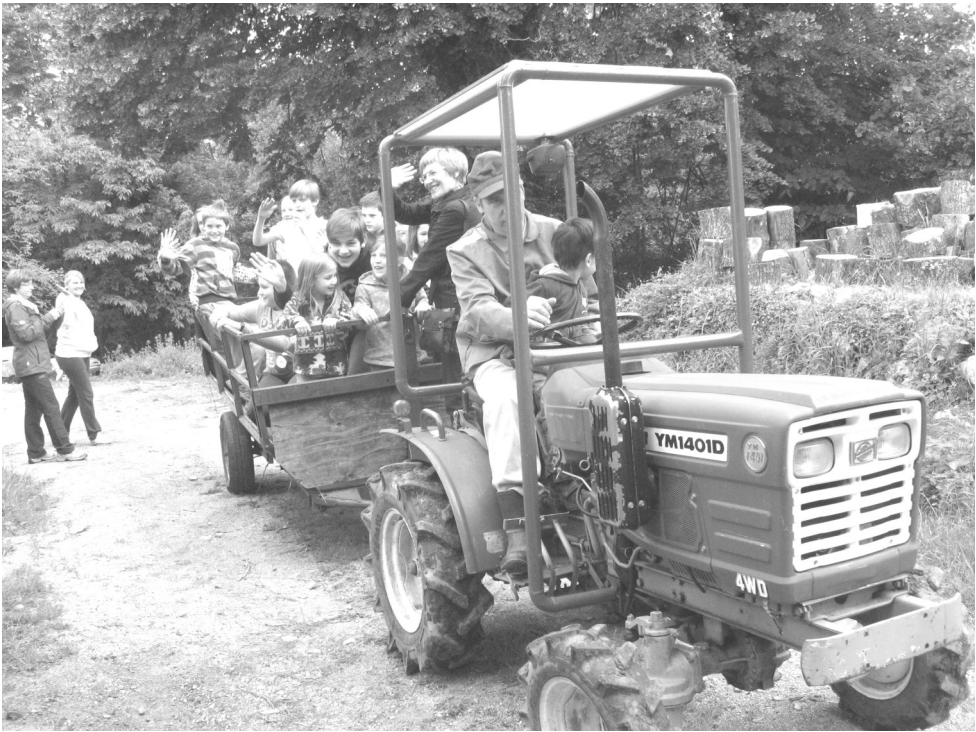
Slika 1: Namesto vožnje z vlakom smrti smo imeli vožnjo s traktorjem veselja!