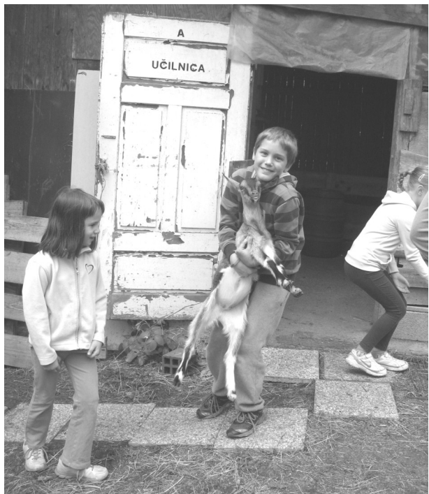
Slika 2: V »učilnici A« so se veroukarji naučili molzti. Ob tem so se spletla ganljiva prijateljstva.