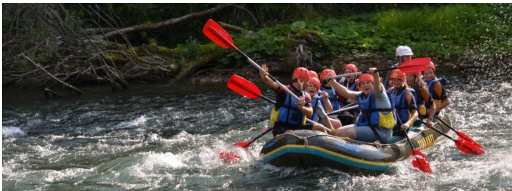
Slika 2 (zgoraj): Bog nas vodi po poteh, ki nam niso vedno všeč. Zato je dobro biti v skupnosti Cerkve, ki je kakor plovilo na tej razburkani poti.