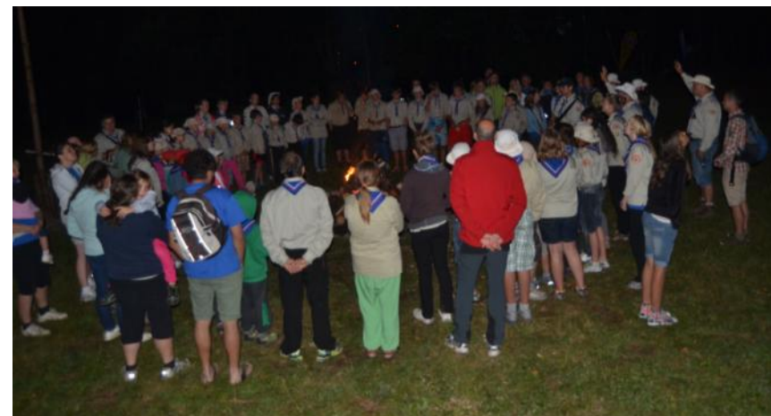
Slika 3 (levo): Zbiranje okoli Boga, ki je vir vsega, je kakor zbiranje okoli tabornega ognja, ki nas ogreje v hladnih dneh.