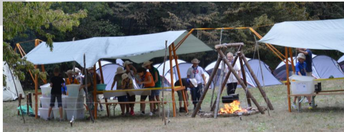
Slika 1 (zgoraj): Postavitev mobilnega tabora. Saj nas Bog nenehno usposablja, zato moramo biti fleksibilni in vedno pripravljen na spremembe.